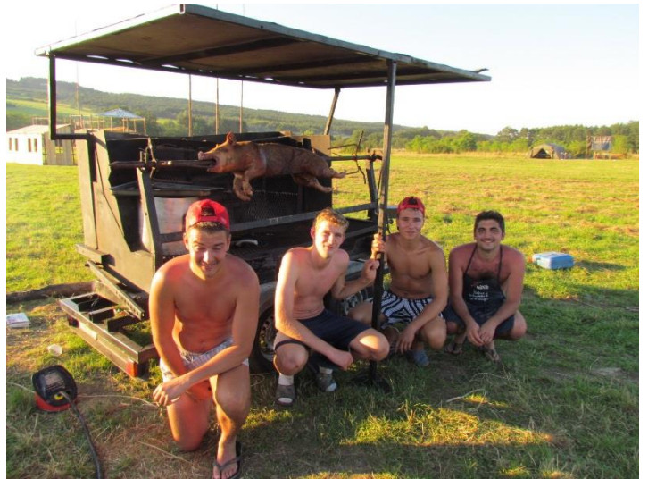
Bighorn, pour la Troupe Albert Schweitzer

Rendez-vous le 17 septembre, pour la montée !